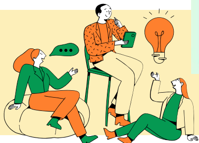
Референтно изображение на Хъба